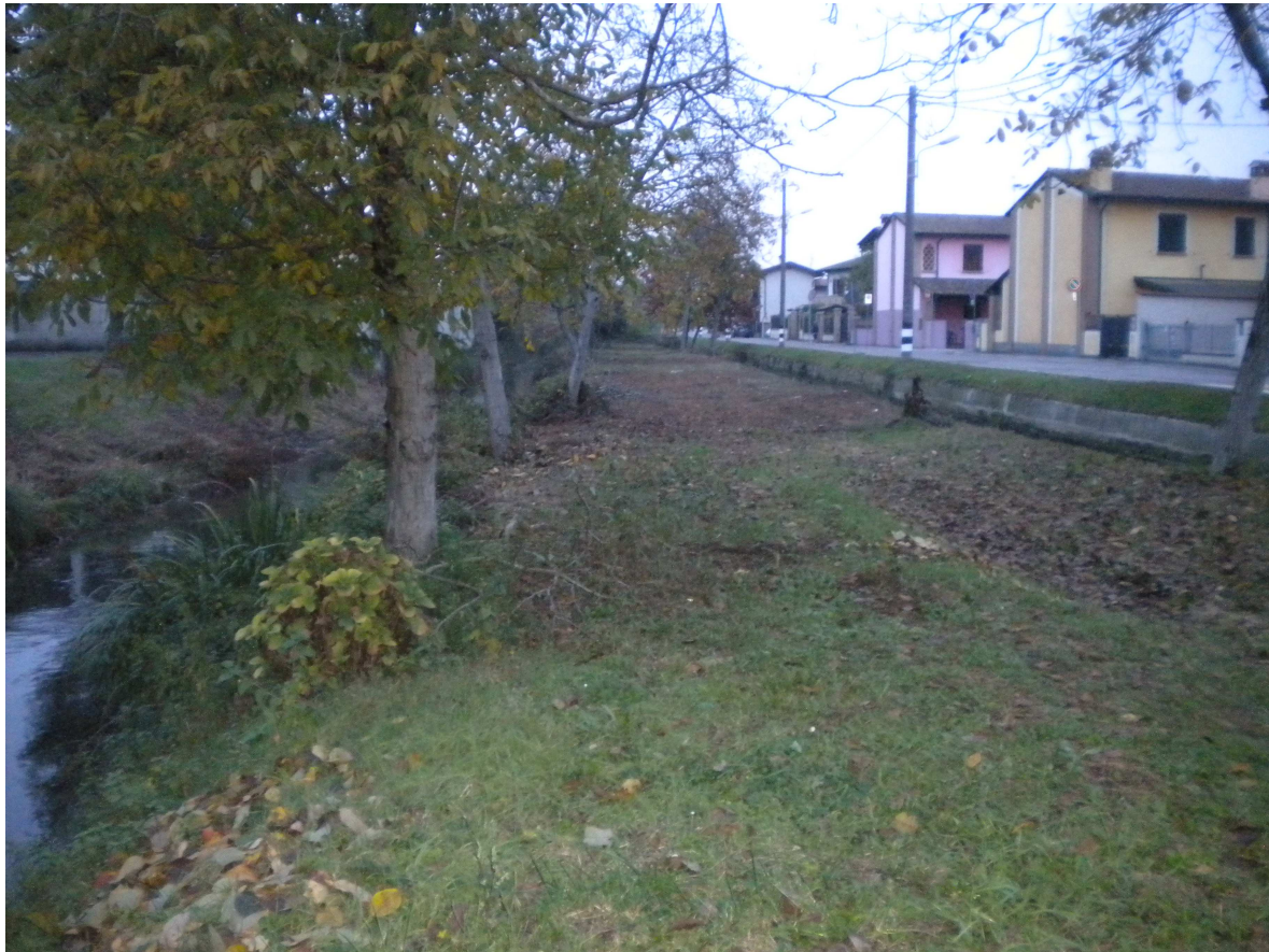
Fig. 4: Da sx a dx la roggia Madonna Gaiazza, il mapp. 359, la roggia Maltraversa, la via Roma – vista nord.