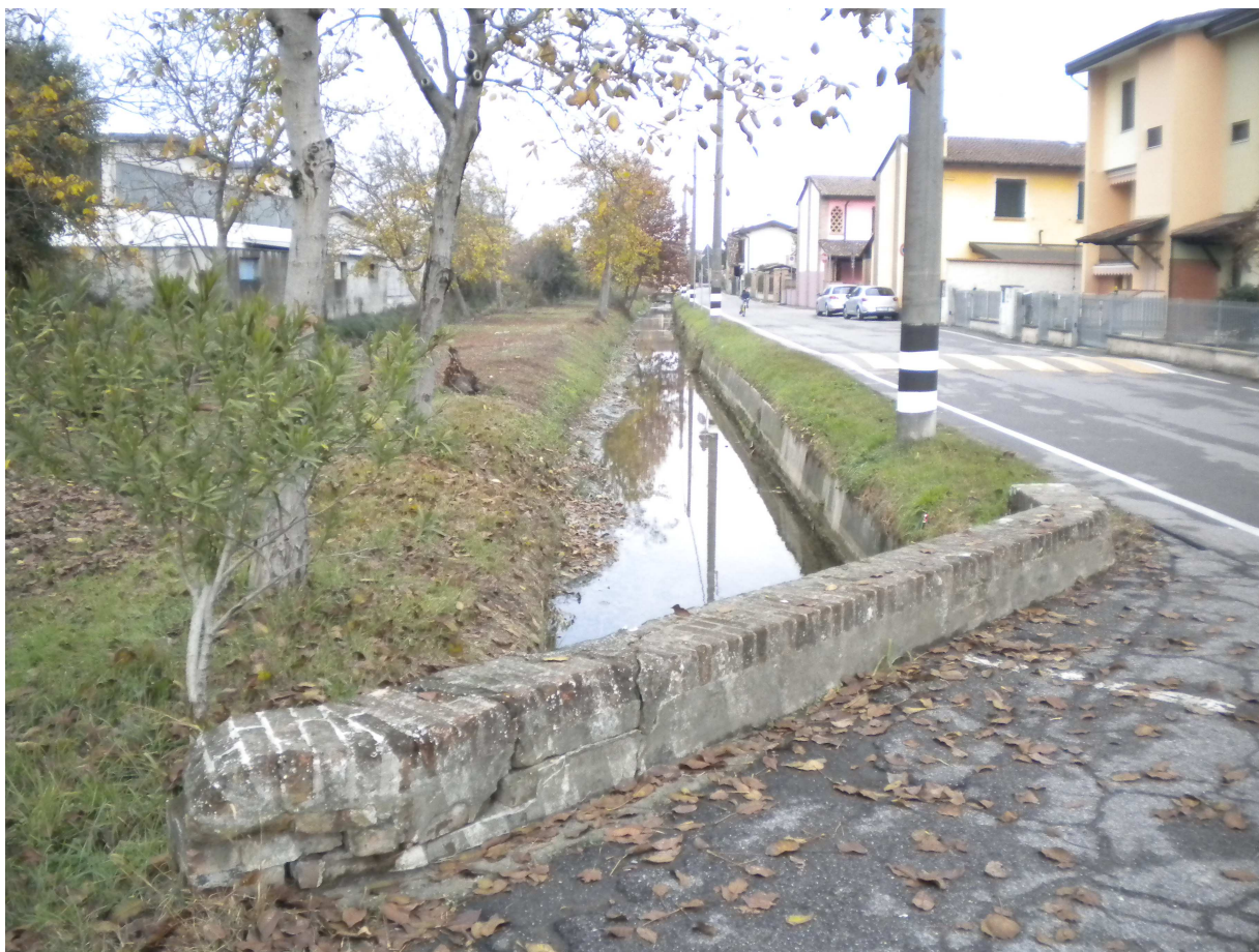
Fig. 2: La roggia Maltraversa e la via Roma – vista nord.