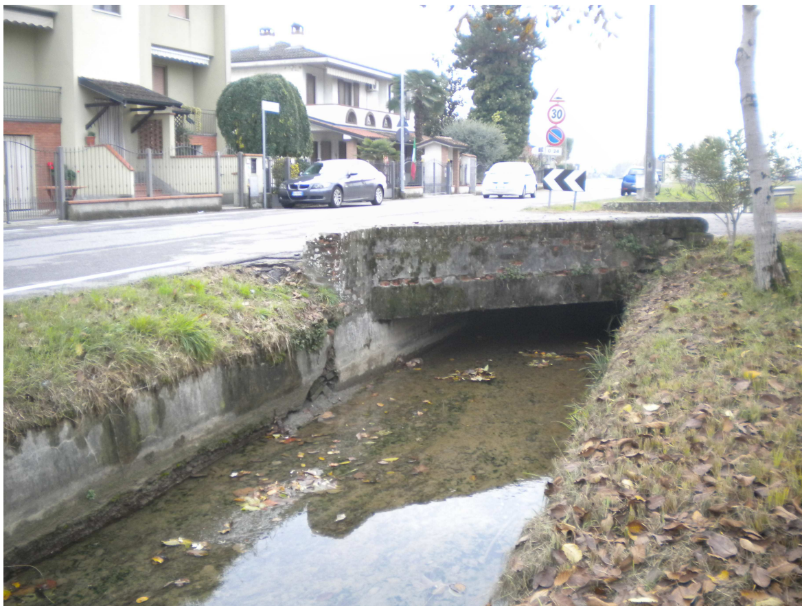
Fig. 3: La roggia Maltraversa con il ponte attuale sulla ex strada comunale e la via Roma – vista sud.