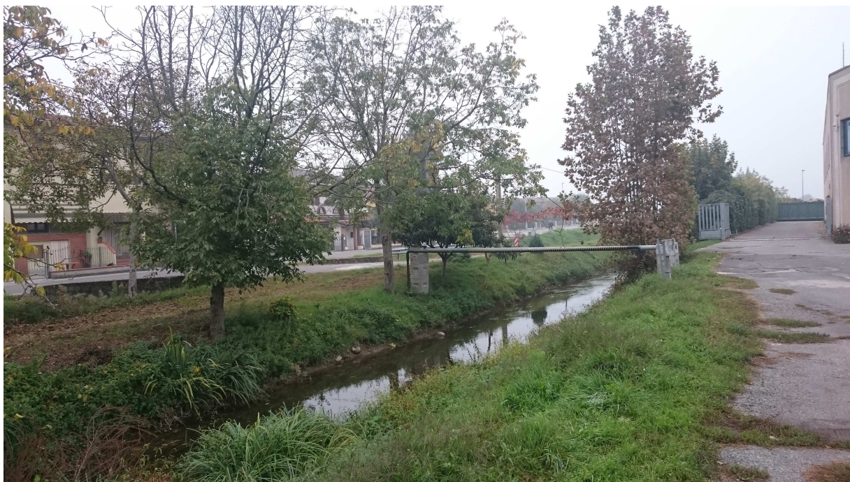
Fig. 1: La roggia Madonna Gaiazza e la via Delle Arti – vista sud.